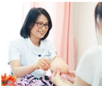
▲看護師による補整下着、乳房パットの説明

当院では、乳がんを告知する際、必ず認定看護師が同席し、その時の患者さんの反応をみながら、先生と対話するためのサポートをしています。医師の説明に不安がないか、これか