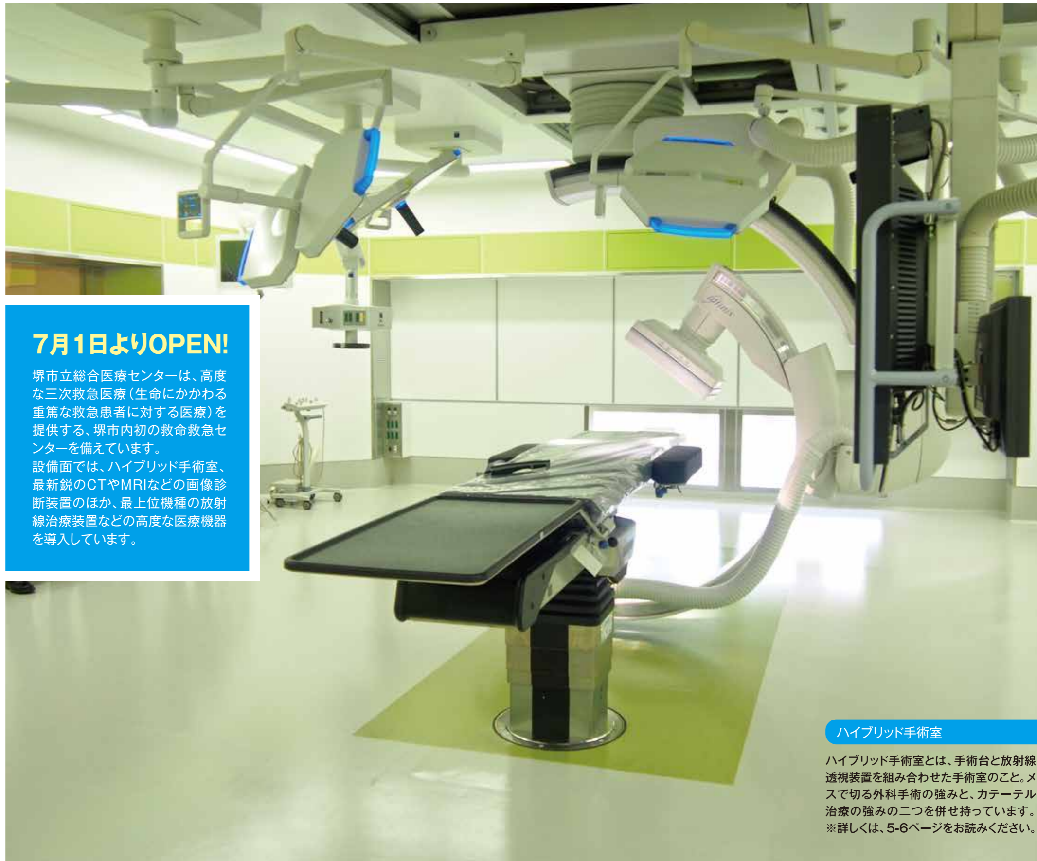
ハイブリッド手術室

新病院の開院に伴い、最新の医療機器設備も多数導入されました。ここでは、一部を写真とともにご紹介します。