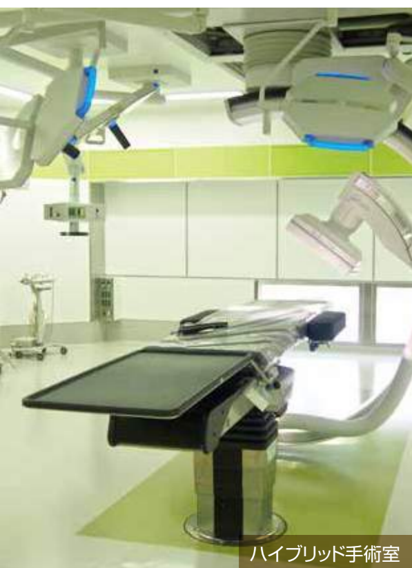
ハイブリッド手術室